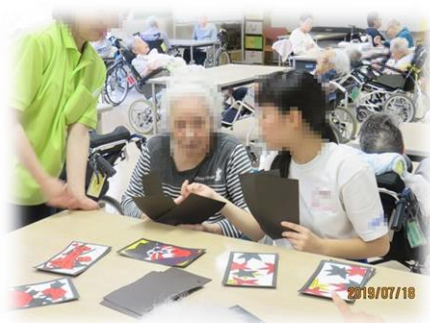
学生さんとの交流会